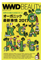
WWD Beauty 5月号