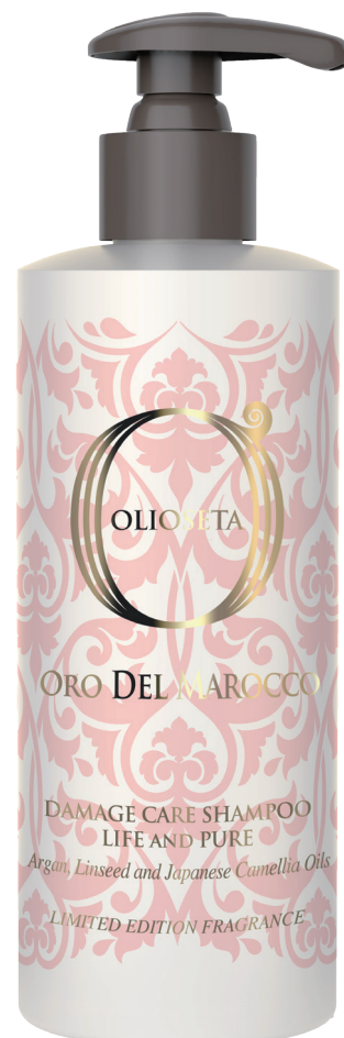
オリオセタ ダメージケアシャンプー ライフアンドピュア 250ml ¥2,300(税別)