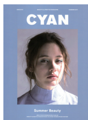
CYAN Summer issue