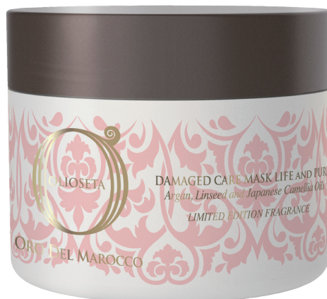
オリオセタ ダメージケアマスク ライフアンドピュア 250ml ¥2,700(税別)

ショート(500円玉1～2枚分) ミディアム(500円玉2～3枚分) ロング(500円玉3枚分～) ※広がりやすい方、ハイダメージの方は使用量を調節してください。